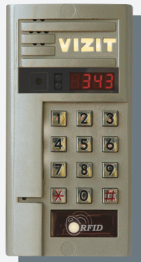
Блок вызова БВД-343FCB