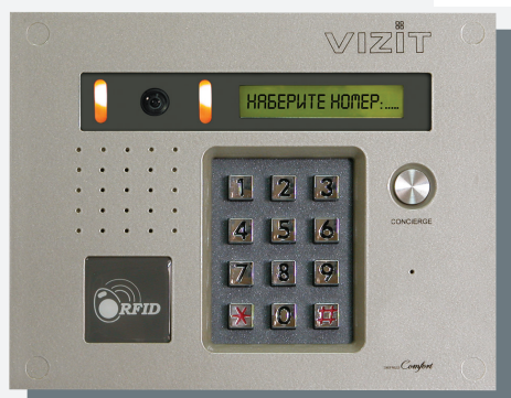
Блок вызова БВД-432FCB