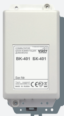
Блок коммутации БК-401